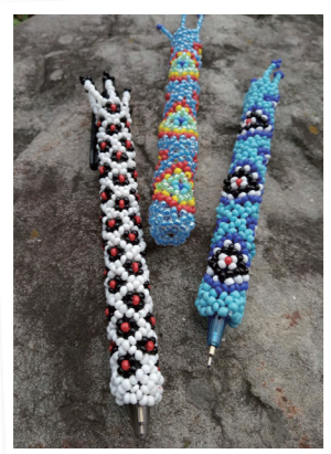
原鄉工藝串珠筆 150元